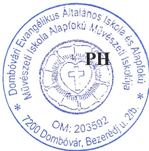
Kocsis Éva tagintézmény-vezető